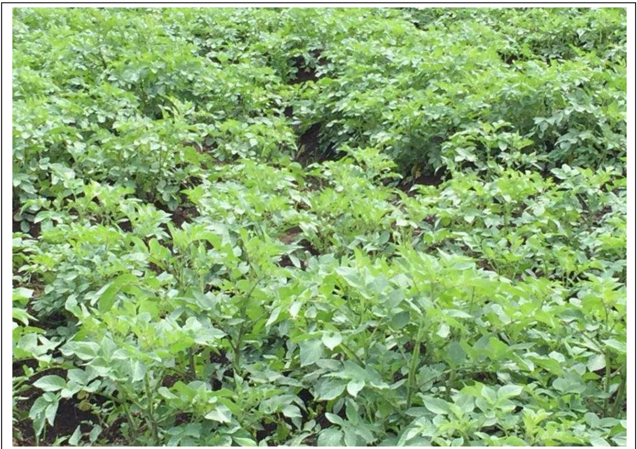
champs école paysanne de pomme de terre dans le groupement MATANDA a BIHABWE

Comme signalé ci haut, la surface cultivée est de 2 hectares. La récolté obtenue est de 150 sacs de 140kgs soit 75 sacs par hectare qui donne une production de 21tonnes. Cette récolté a pu donner un surplus sur le patrimoine de l'organisation et aux membres de l'association car grâce à cela, on est parvenu à donner un sac de 140kgs a chaque membre pour lui permettre de commencer une activité commerciale lui permettant de gagner quelque chose pour sa survie. de l'organisation qui vivent dans la zone où s'est réalisée cette activité. Etant donné que nous avons 12 membres bénéficiaires dans la zone, Cela a contribué à l'amélioration de la sécurité alimentaire dans le cadre de lutter contre la mal nutrition. Précisons que pour cette culture, PROJDA avait mis en place trois champs Ecoles paysans (CEP)